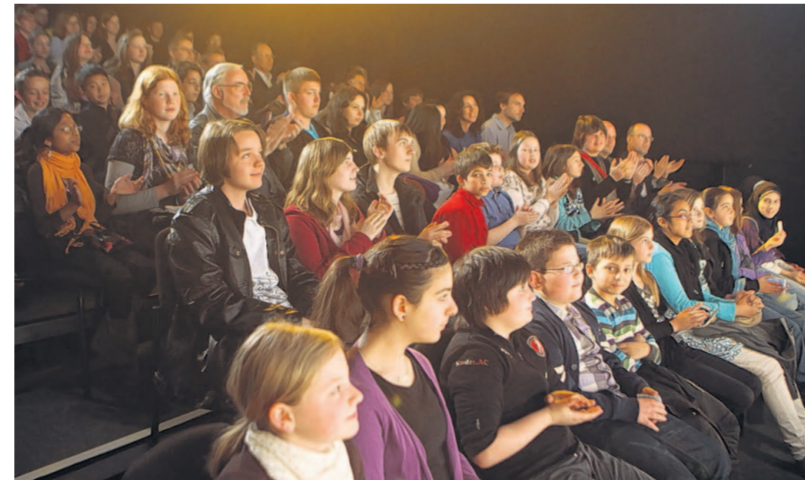
Im Bann: Erst gab's für die rund 100 Netrace-Schüler im Das Da Theater das dramatische Stück „Creeps“ zu sehen. Nach der Mittagspause und vier Theater-Workshops ging es mit der spannenden Siegerehrung weiter.