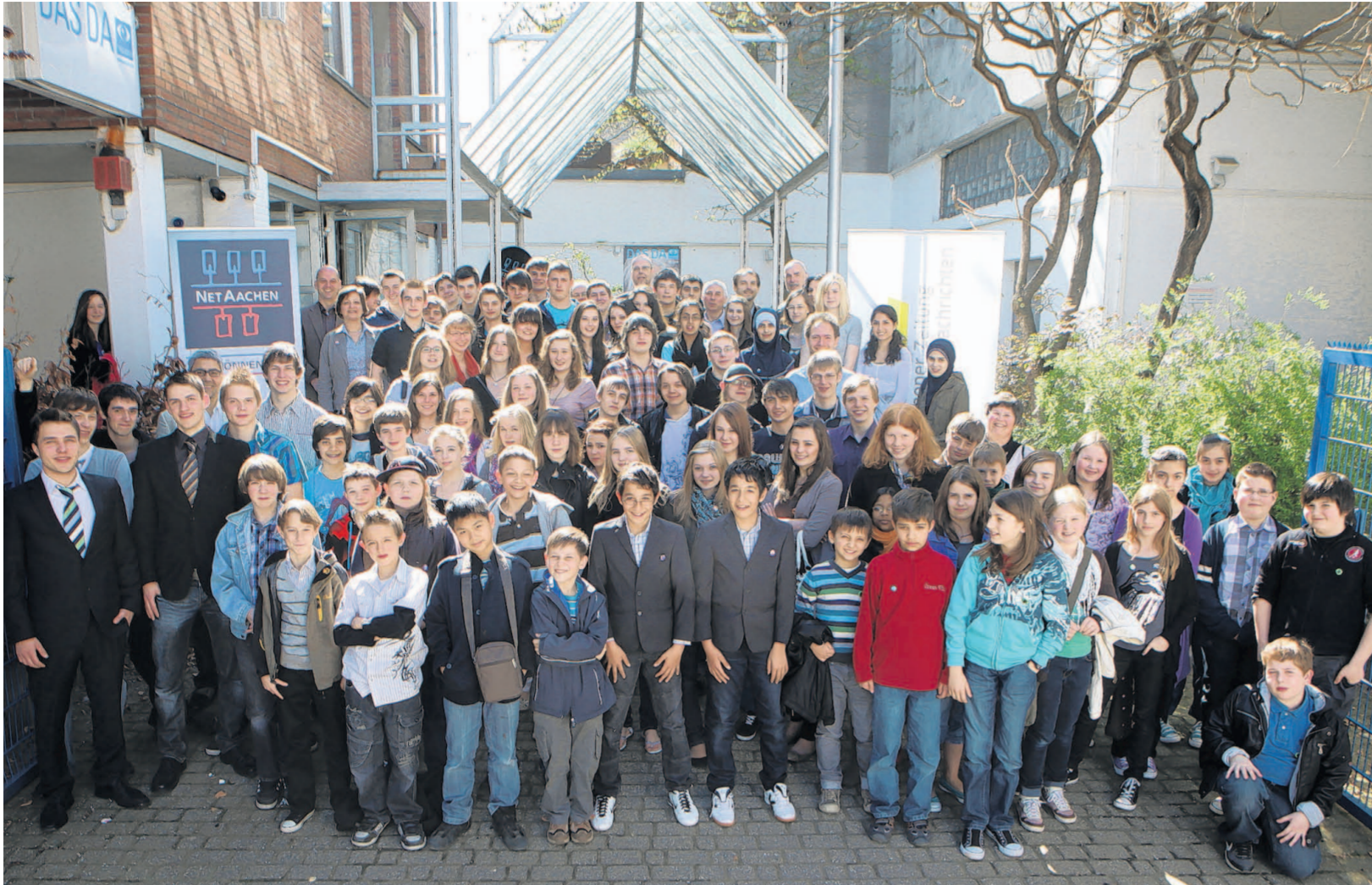
Im Fokus: Die rund 100 Schüler und ihre Lehrer der zehn besten Netrace-Teams stellen sich vor dem Das Da Theater dem Fotografen.